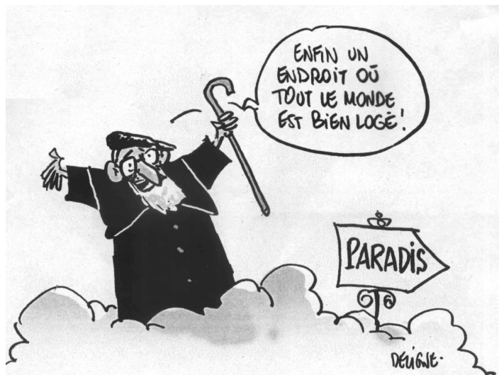
Dessin extrait du « Pèlerin » n°6478