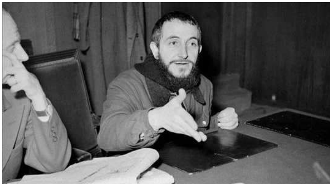
L'Abbé Pierre lors de l'appel radiophonique de 1954.